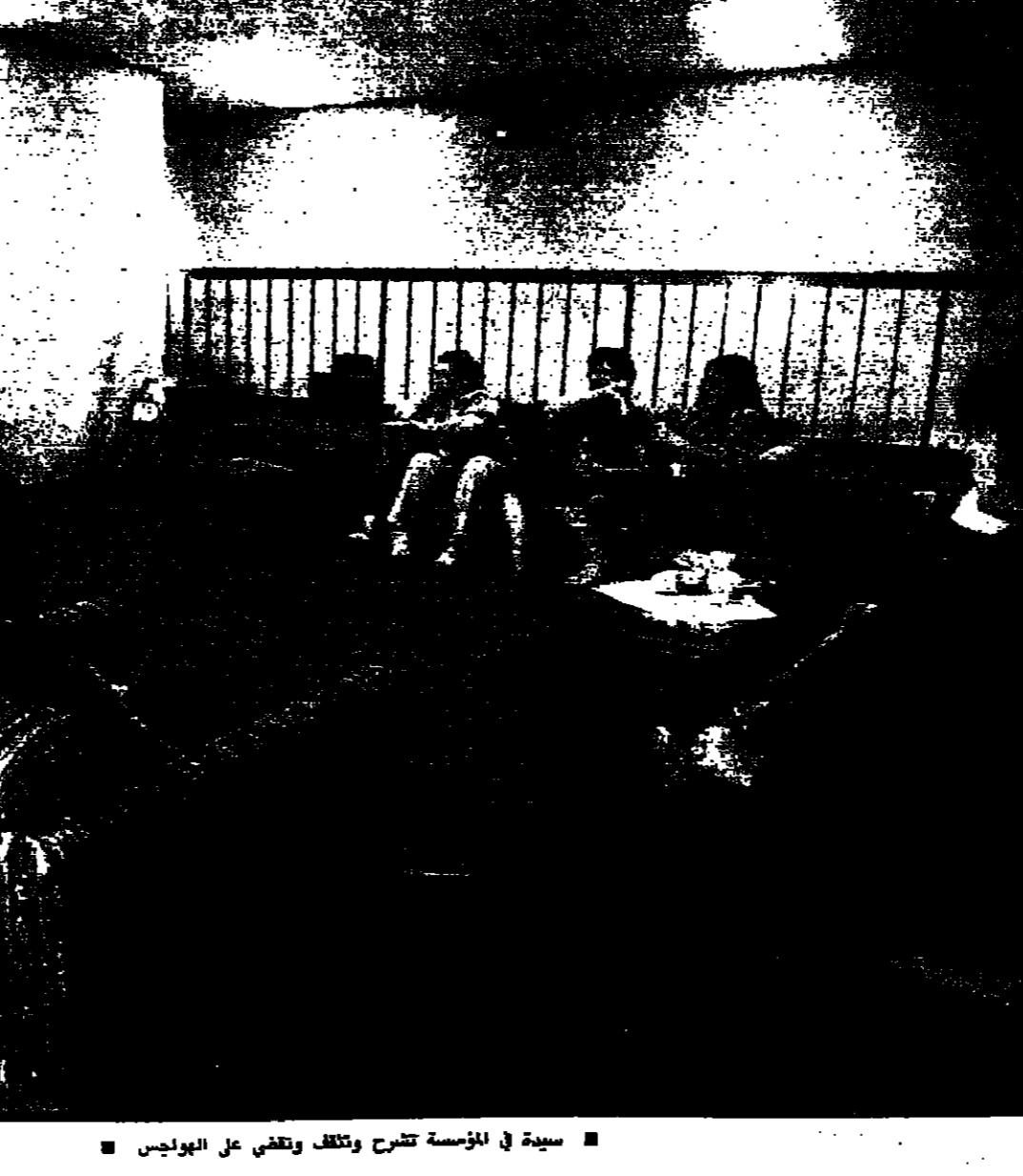
تتصل هاتفيا بـ الزوج - الغائب بعد الفضا على وسوس - العمل - للمشروع -